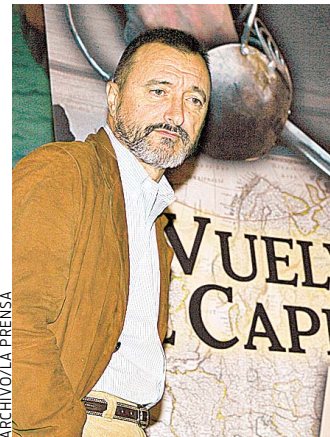
Arturo Pérez Reverte, autor de la saga del capitán Alatriste.

A rturo Pérez-Reverte navega por esa "frontera ambigua y peligrosa" que era el mar Mediterráneo del siglo XVII en "Corsarios de Levante", la sexta entrega de las aventuras del capitán Alatriste, un personaje que supo sobrevivir en "el mundo cruel y peligroso" de entonces, pero que en el de hoy "sería un marginado total". "Alatriste era un mercenario, pero tenía su ética, sus reglas del juego", dijo el autor.